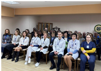
В ходе встречи руководитель комитета ознакомилась с направлениями работы предприятия, достигнутыми результатами и планами на перспективу.

Так, в отделе электромагнитных и теплотехнических измерений ей было продемонстрировано эксклюзивное оборудование для поверки приборов измерения концентрации паров алкоголя в выдыхаемом воздухе, позволяющее проводить поверку таких типов, как «Динго» и «Алкобарьер» для предприятий всей республики.