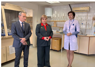
Акцент в отделе испытаний - определение показателей безопасности при помощи газо-жидкостной хроматографии, а также высокоэффективной жидкостной хроматографии, которая является на сегодня ключевым методом хроматографического анализа и одним из ведущих методов аналитической химии.

Также был продемонстрирован процесс поверки термометров, электросчетчиков, электроизмерительных средств измерений, термометров. При этом был отмечен значительный объем приборов, находящихся в поверке, от предприятий - изготовителей Полоцкого региона.